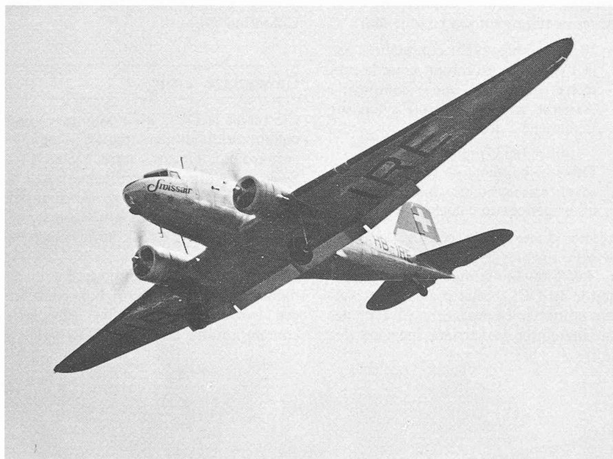
Fig. 1. — L'avion qui a fait connaître le nom Douglas dans le monde entier: le DC-3. La photographie représente l'un de ceux acquis avant la guerre par Swissair et qui a repris du service pour de longues années après le conflit.

L'essor de l'industrie créée par Douglas ne date pas du DC-3; il nous paraît intéressant d'en rappeler ici quelques étapes marquantes.