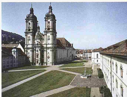
Stiftsbezirk St. Gallen, barocke Kathedrale und Klosterhof

wichtig, diese positive Seite zu unterstreichen. Die Welt rückt – nicht zuletzt übers Internet – näher zusammen. Junge Leute sollen deshalb bereits in der Schule erfahren, dass es nicht nur im eigenen Land das Berner Münster, sondern auch in fernen Ländern ebenso bedeutende Kulturstätten gibt, vielleicht mit dem Unterschied, dass sich niemand darum kümmert.