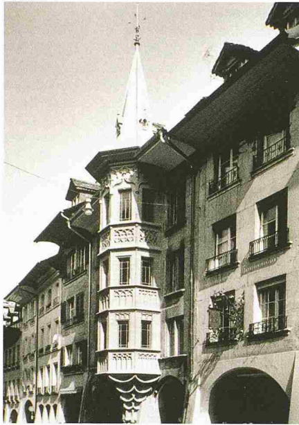
Berner Altstadt, Münstergasse 62