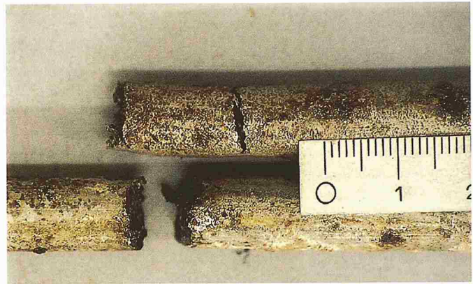
2 Befestigungsbügel der abgehängten Decke des Hallenbads Uster mit Korrosions- rissen, deutlich ist das spröde Bruchverhal- ten erkennbar

verbindliche Definition über deren chemische Zusammensetzung und physikalische Eigenschaften. Der Begriff «Edelstahl» für sich alleine verwendet, bedeutet nur, dass es sich um eine Stahlsorte handelt, die besonders rein hergestellt wurde. Der Begriff gibt keine Auskunft über die Korrosionsbeständigkeit, da es sowohl unlegierte als auch legierte Edelstähle gibt.