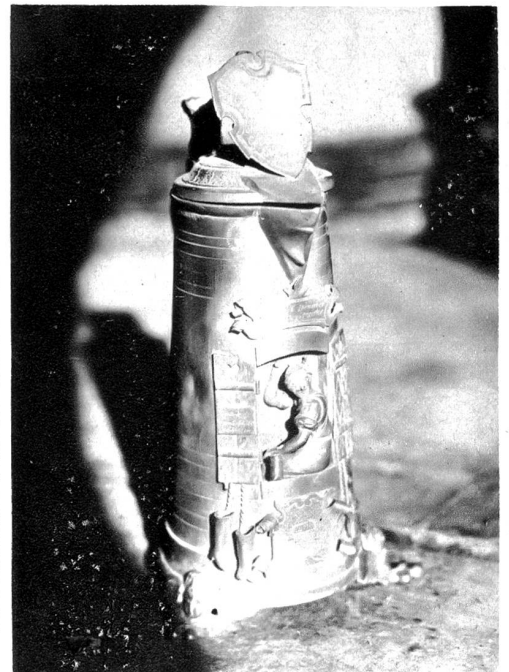
E alti Channi