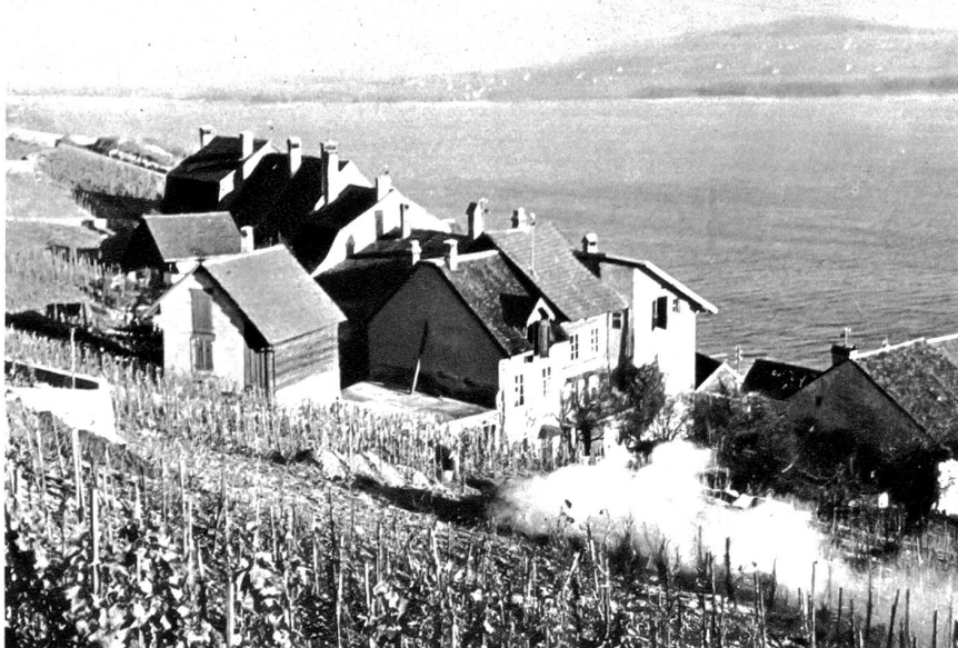
Tüscherz am See