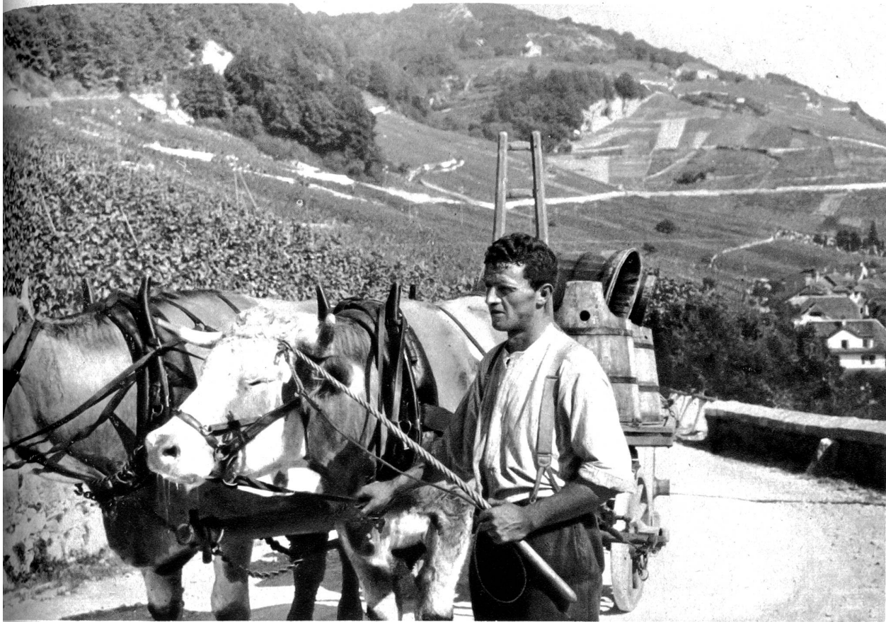
Es git e grossi, gueti Fuehr