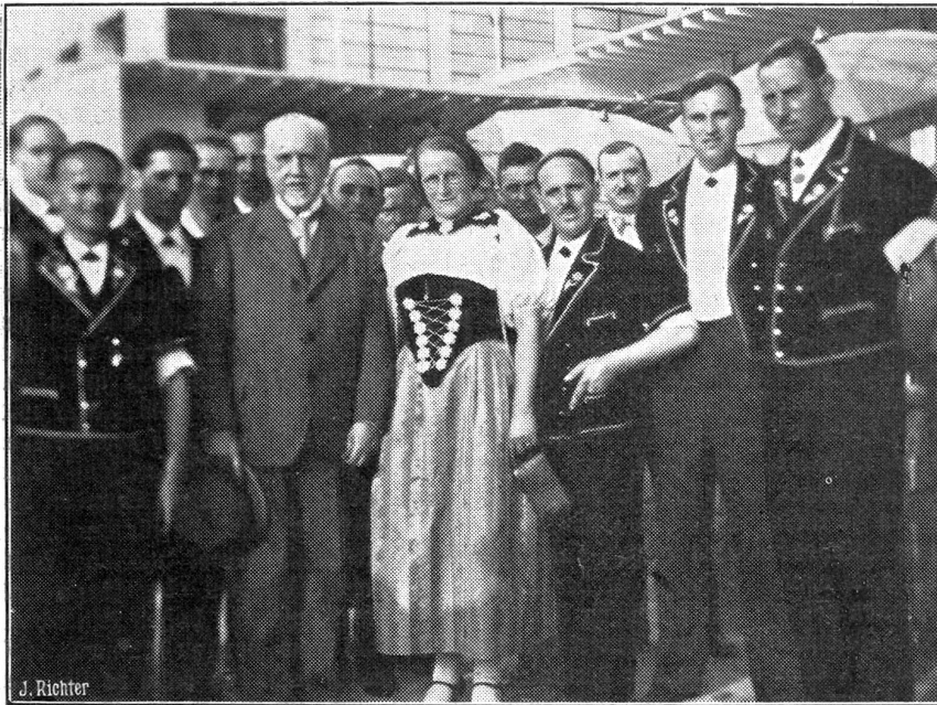
Thuner Jodler im Schweizer-Pavillon an der Weltausstellung in Paris.

Der Jodelklub Thun besuchte die Weltausstellung in Paris, wo er mehrere erfolgreiche Konzerte zum besten gab. — Unser Bild zeigt den Jodelklub anlässlich seines Besuches an der Weltausstellung; in seiner Mitte ist unser Gesandte in Paris, Minister Dunant.