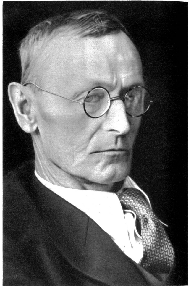
Der Dichter Hermann Hesse feiert am 2. Juli seinen 60. Geburtstag

Nach ungefähr drei Stunden Schlafes erwachte sie plötzlich, weil ein ausgehungertes Insekt, froh des willkommenen Schmaufes, sie heftig in den Fuß stach. Sie wußte nicht so recht, wo sie war, hörte aber ein Geräusch, ein unbekanntes, sonderbares. Schritte, und doch keine Schritte, ächzen, atmen, dann