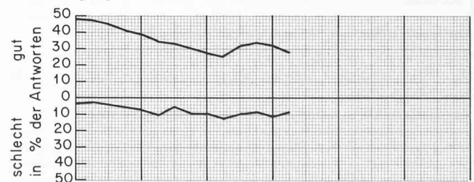
Auftragseingang, Gesamtergebnis (in Prozenten der Antworten)