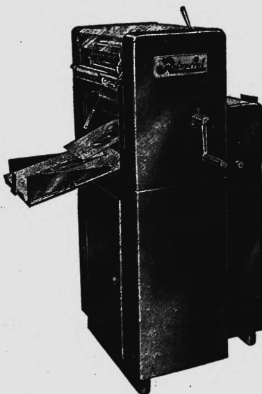
ROTAPRINT Modell R70