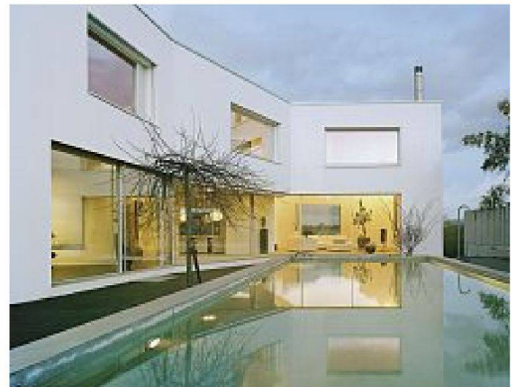
Bilder: Ruedi Walti