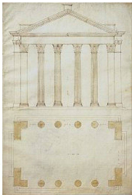
Andrea Palladio, Grundriss und Aufriss des Portikus der Otavia in Rom, nach 1550

Ausstellung «Andrea Palladio: His Life and Legacy», Royal Academy of Arts, London, bis 13. 4. 2009. Katalog herausgegeben von Guido Beltrami und Howard Burns für £27,95 (Softcover). Weitere Stationen der Ausstellung: Caixaforum Barcelona, 19. 5.–6. 9. 2009; Caixaforum Madrid, 6. 10. 2009–17. 1. 2010.