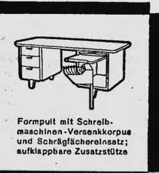
Formpult mit Schreibmaschinen-Versenkkorpus und Schrägfächerersatz; aufklappbare Zusatzstütze

Das Formpult unterscheidet sich von den früher gebräuchlichen Pulten und Schreibtischen durch vollständig neue Linienführung, verbunden mit zeitloser Eleganz und grösster Zweckmässigkeit. Es ist nach einem Spezialverfahren - Hochfrequenzverleimung und Formpressung - hergestellt und hat so ein um 25% geringeres