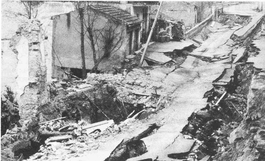
Bild 2. Strassenschäden in Calitri

bardi, Conza di Campania, Lioni und Laviano. Das Epizentrum des Bebens liegt etwa 5–7 km nördlich von Laviano, wobei sich das Gebiet mit grossen Schäden von Avellino bis Potenza in west-östlicher Richtung und von Grotaminarda bis Salerno in nord-südlicher Richtung erstreckt und eine Fläche von annähernd 3000 km 2 überdeckt. Innerhalb dieses Bereichs wurden im Mittel Intensitäten von VII und grösser in der MSK-Skala angetroffen. Darüber hinaus wurde das Beben bis zu relativ grossen Entfernungen von 700–800 km in Norditalien wahrgenommen.