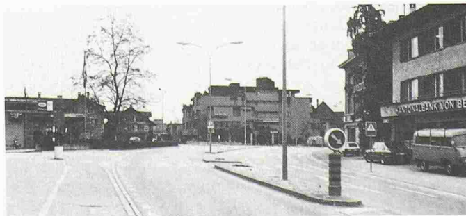
Der gleiche Platz heute: es heisst nur noch rechtzeitig einspuren... (Bilder aus: «Münsingen, Erinnerung und Gegenwart»)