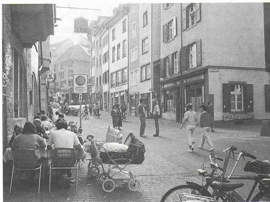
Nachmittags – während der Sperrzeit – wird die gleiche Strasse zum Treffpunkt