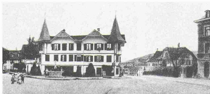
Vor der Druckerei, einem typischen Gebäude von Münsingen BE, trennte sich früher die Strasse links in Richtung Tägertschi, rechts in Richtung Thun

Dies ist die architektonische Betrachtungsweise. Strassen und Plätze hatten aber zudem in der Vergangenheit eine wichtige gesellschaftliche Bedeutung. Sie waren einerseits der Ort der kollektiven Produktion und des Güterausstausches – denken wir nur an die Handwerkerassen und die Marktstrassen –, andererseits der Raum, in dem neben Gütern auch Gedanken und Meinungen ausgetauscht und Streitigkeiten ausgetragen wurden. Das alte Foto von Münsingen BE erzählt davon.