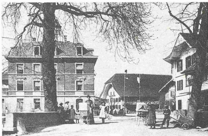
Der Dorfplatz als Begegnungsraum, Münsingen Anfang des Jahrhunderts