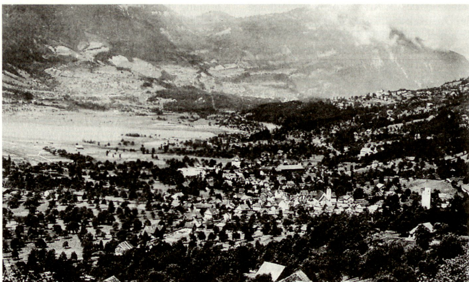
Steinen, Aufnahme aus den 1930er-Jahren, mit der damals schon herausragenden Obermühle.

Obwohl Bundesrat Kobelt auf Grund der vorläufigen Beendigung des Aufruhrs gegen Abend des 22. Septembers vorerst keine weiteren militärischen Massnahmen anordnete, wurde das Füs Bat 105 auf Pickett gestellt, worauf Oberstleutnant Graf, Kdt des Füs Bat 105, um 22.25 Uhr eigen-