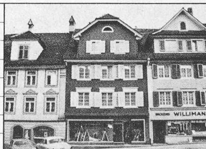
Karteiblatt zur Methode der Denkmalpflege (Seite 116). In Bildmitte das Wohn- und Geschäftshaus der Tuchhandlung Lüthi

BESCHREIBUNG 3-gesch. verputzter Massiv/Fachwerkbau über Rechteckgrundriss, schmal-seitig zum Flecken. Gleichflüchtig zwischen den Nachbarbauten. Gemeinsame Trauf- und Firstlinie mit Nr. 237, jedoch versetzt gegenüber Nr. 239. Fassade (N): Hochrechteckiges unauffälliges Zeilenelement. 3 regelmässig gereichte Fensterachsen in den OG, modernistischer störender Ladeneinbau, von den OG durch breites Vordach getrennt. Massive 2-achsige Giebelgauben mit Krüppelwalmen. An Rückseite 2-gesch., geschosswise abgetrepter Flachdachvorbau, der 2 Drittel der Hausbreite einnimmt. Garten mit plattengedeckter Stützmauer zur Gerbergasse. Bedeutend als Glied der geschlossenen Häuserzeile.