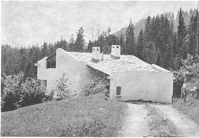
Rudolf Olgiati: Haus Van der Ploeg in Laax

artikulierte Elemente, die im Boden der regionalen Bau-traditionen verwurzelt sind, mit Vokabeln, die – längst über die von ihren Schöpfern ihnen zgedachte Funktion hinausgewachsen – gleichsam zu internationalem Gebrauch bereitliegen. Es ist diese Synthese, welche das Besondere ausmacht in Olgiatis Architektur. Die Eigenart des Zusammenwirkens der zwei ungleichen Ingredienzien ist tatsächlich erstaunlich. Sie prägt das Werk des Architekten durch die Jahrzehnte seines Schaffens. Mit verbissener Konsequenz und Aufrichtigkeit verfolgt er ein formales Konzept, das selbst in jenem Grenzbereich noch Anerkennung abfordert, wo die virtuose Durchmischung der selbstgewählten Gestaltungselemente den Bezirk des Spielerischen oder des betont Gewollten streifen.