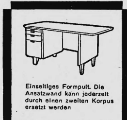
Einselliges Formpult. Die Ansatzwand kann jederzeit durch einen zweiten Korpus ersetzt werden