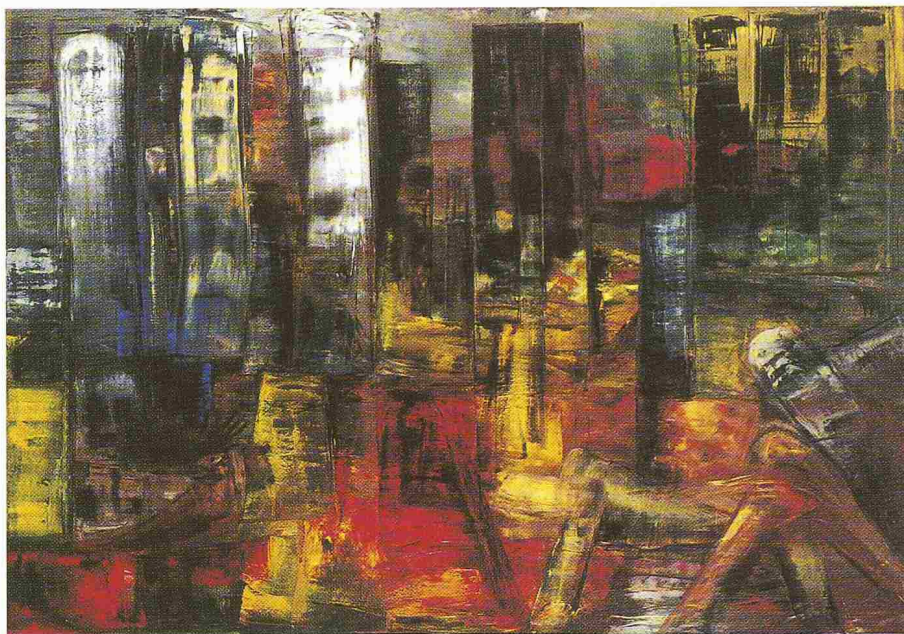
Die Stadt, Klaudia Schifferle, 1989