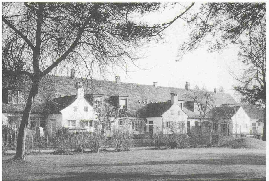
Winterthur schützt durch planerische Massnahmen seine typischen, familienfreundlichen Wohnformen des 19. und frühen 20. Jahrhunderts. Hier die Bernoulli-Siedlung Weberstrasse der Heimstättengenossenschaft (erbaut 1923/24). Die meisten der früheren Waschküchen sind inzwischen zu Wohnküchen umgebaut worden

Heimatschutzkreise bemühen sich seit Jahren um eine Aufwertung der architektonischen und städtebaulichen Beiträge des 19. und frühen 20. Jahrhunderts. Diese Epoche hat unsere heutigen Verhältnisse weit mehr geprägt als die bäuerlich-feudale Zeit. Die Aufklärung und die aus ihr hervorgegangenen Naturwissenschaften, die auch die technische Entwicklung ermöglichten, vermochten viel Elend zu beseitigen.