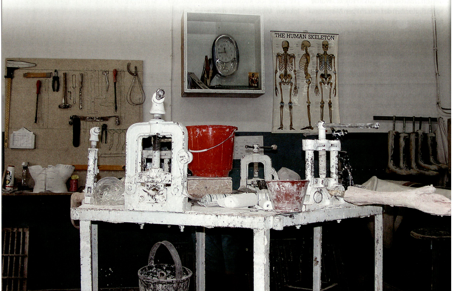
Blick in die Orthopädiewerkstatt des IKRK.

Bedauerlicherweise sind die auffällig gekennzeichneten Geländefahrzeuge internationaler Hilfsorganisationen, welche in grosser Zahl auf den wenigen befahrbaren Strassen des Landes anzutreffen sind, für die Bevölkerung Afghanistans leichter erkennbar als die Früchte deren Arbeit und Präsenz. ■