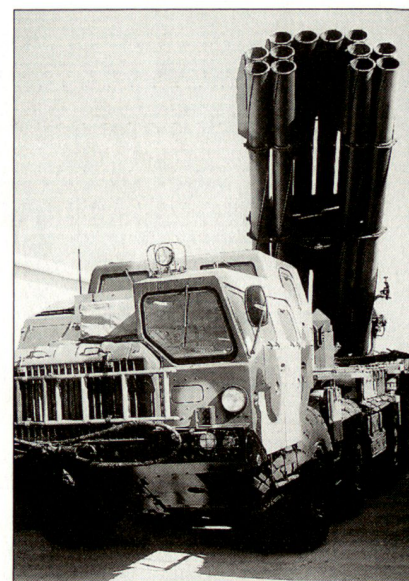
Schwerer russischer Mehrfachraketenwerfer 300 mm «Smerch».

schen Streitkräften durchgeführten Testversuche seien äusserst erfolgreich gewesen. Mit einer Einführung dieses Aufklärungssystems und allenfalls auch Exporten in die Armeen der Golfstaaten ist in nächster Zeit zu rechnen. hg