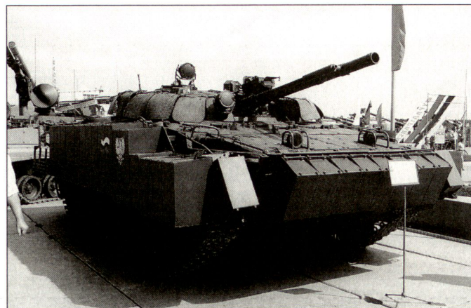
Kampfschützenpanzer BMP-3 mit Zusatzpanzerung.

über eine Zusatzabdeckung am Turm sowie über sehr voluminöse Zusatzpanzerungen an der Fahrgewanne. Hier dürfte es sich um eine neue Generation von Reaktivpanzerung handeln.