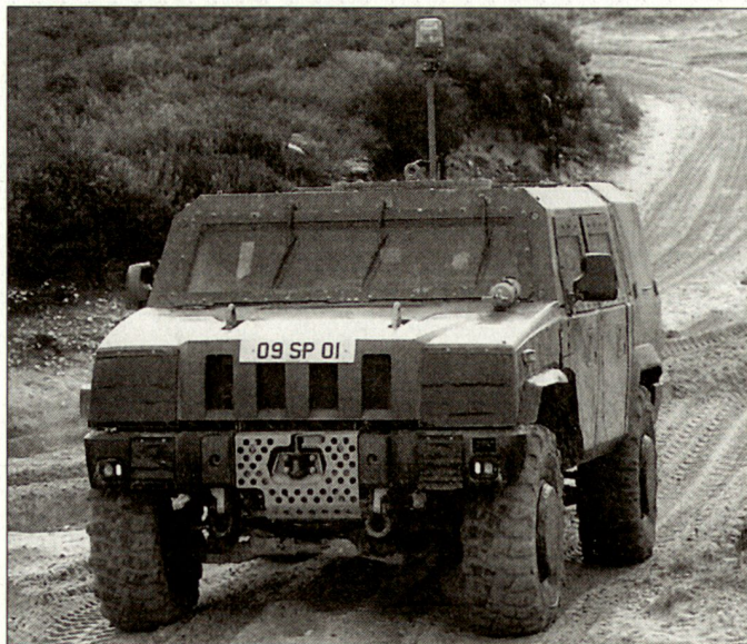
Das leichte Mehrzweckfahrzeug MLV «Panther» soll in der britischen Armee vor allem als Kommando- und Aufklärungsfahrzeug eingesetzt werden.

2015. In den nächsten Jahren sollen bei der britischen Armee auch die leichten Geländefahrzeuge erneuert werden. Vorgesehen ist dabei u. a. die Beschaffung von einigen hundert geschützten Mehrzweckfahrzeugen (4x4) «Panther». Der Auftrag zur Lieferung dieser Fahrzeuge ging noch im Jahre 2004 an die Firma Alvis Vickers, die zur Firmengruppe BAE Land Systems gehört. Beim leichten Geländefahrzeug «Panther» handelt es sich um eine Entwicklung des italienischen Fahrzeugherstellers Iveco mit Sitz in Bolzano. Es ist vorgesehen, dass die erste Serie von Fahrzeugen vom italienischen Hersteller direkt an die britische Armee geliefert wird. Später sollen gewisse Fahrzeugkomponenten und die Endmontage in den Werken von Alvis Vickers in Grossbritannien selber vorgenommen werden. Mit der Einführung der als MLV (Multipurpose Light Vehicle) bezeichneten Fahrzeuge bei der britischen Army ist ab dem Jahre 2007 zu rechnen. hg