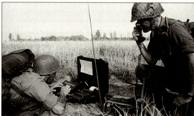
Bereits ab 2006 wird der Grundwehrdienst im österreichischen Bundesheer nur noch sechs Monate betragen.

Mit Ausnahme der zeitlich vorgezogenen Reduktion des Grundwehrdienstes handelt es sich bei den präsentierten Massnahmen um konkrete Empfehlungen der Bundesheer-Reformkommission vom letzten Jahr. Trotz der noch laufenden Diskussion kann davon ausgegangen werden, dass die Reform 2010 in Österreich umgesetzt wird, wobei die Schliessung von 40% der bisherigen Truppenstandorte am schwierigsten durchzusetzen sein wird. hg