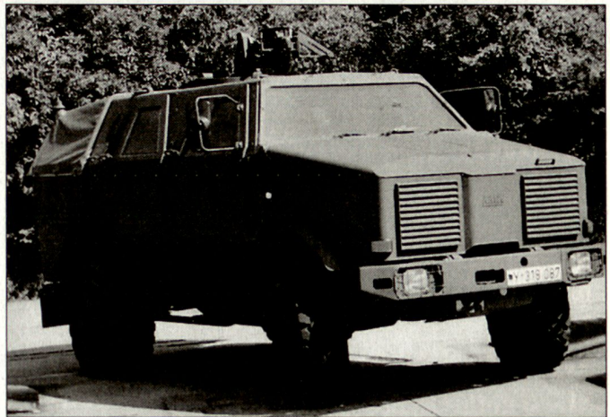
Erneuter Beschaffungsauftrag für das Allschutzfahrzeug «Dingo».

«Dingo 2» beschlossen. Die diesbezügliche Bestellung ging an den deutschen Rüstungsproduzenten Krauss-Maffei Wegmann. Der Auftragswert beläuft sich auf rund 170 Mio. Euro. Darüber hinaus wurde eine Option für die Beschaffung