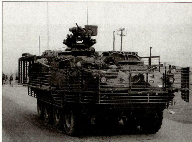
Zum Schutz gegen RPGs sind die Schützenpanzer «Stryker» im Irak mit einer Gitterrostpanzerung versehen worden.

Lizenznehmer General Dynamics Canada werden die als «LAV III» bezeichneten leichten gepanzerten 8x8-Radfahrzeuge von 19 Tonnen Gefechtsgewicht leicht modifiziert gefertigt. Insgesamt sollen bei General Dynamics in Kanada und den USA 2131 Schützenpanzer für die insgesamt sechs vorgesehenen «Stryker»-Brigaden produziert werden. Die Irak-Erfahrungen haben die Bedeutung der Brigadestrukturen bestätigt, sodass diese im Transformationsprozess bestimmendes Strukturelement bleiben. Die Zahl der Brigaden wird bis Ende 2006 – u. a. durch die Auflösung von sieben Divisionen im aktiven Heer auf 43 erhöht. Dabei handelt es sich um 20 schwere, mechanisierte und neun leichte motorisierte Brigaden, fünf mittlere «Stryker»-Brigaden sowie neun Luftlandebrigaden. Zudem werden in einer Anpassung nach den jüngsten Einsätzen im Irak Übermittlungs- und Aufklärungskräfte sowie die Flab, Artillerie und Genie vollständig