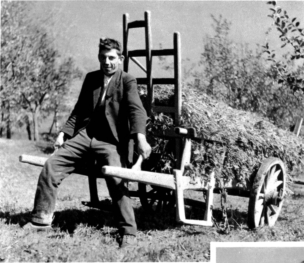
Mit den Grasschnecken muss an den meisten Orten der Wynigenbergen das Futter eingeholt werden.

marschieren durch ein kleines walddunkles Tälchen nach Kappelen, wo seit über 200 Jahren ein kleines Heilbad Rheumatikern Heilung zu bringen sucht. Wer nicht mehr der hier weitausholenden Straße folgen will, zweigt wenig oberhalb des Bades links ab und steigt durch schönen Wald und durch Wiesen zum kleinen Dertchen Friesenberg. Da ist wieder so eine stattliche, runde Kuppe, ein schöner Aussichtspunkt. Früher trönte ihn die stolze Burg der Edlen von Friesenberg, einem Geschlecht, das auch in Rüderswil und Regenstorf Besitzungen hatte. Es erlosch im 14. Jahrhundert. Die Burg gehörte 1382 dem Petermann von Mattstetten, einem Vasallen der Grafen von Kyburg. Sie wurde im Burgdorfer Krieg von 1383 so gründlich zerstört, daß heute keine Mauern mehr sichtbar sind. Nur der mächtige Burggraben hat sich erhalten.