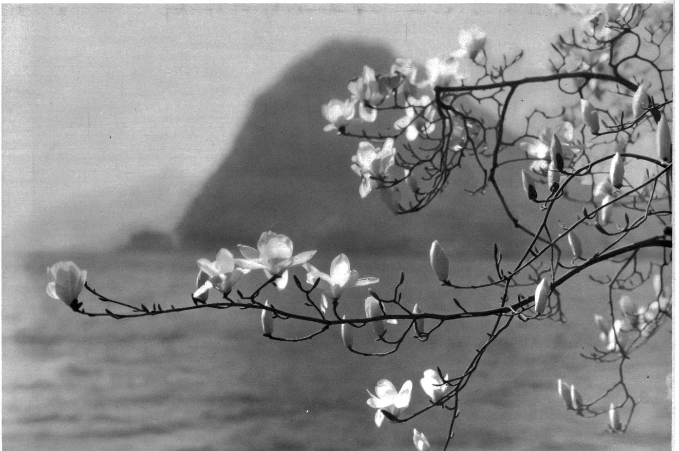
Magnolienpracht in Lugano