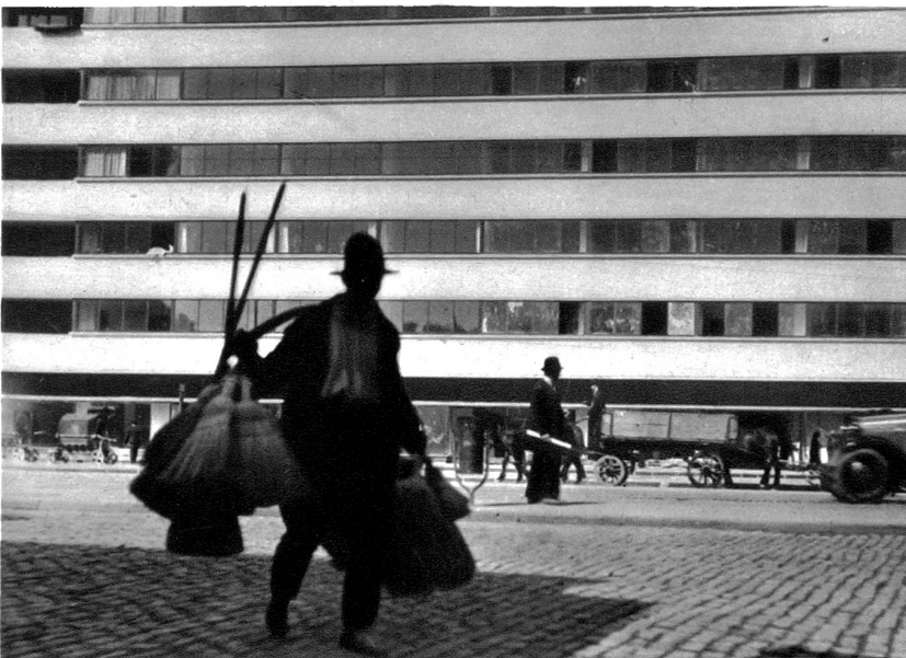
Der Besenhandler im neuen Viertel. Ob er seine Ware nicht bald mit Staubsaugern auswechseln wird?