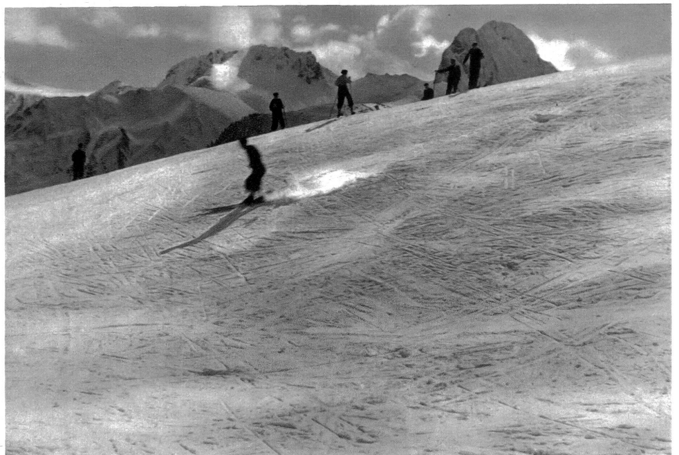
Krummfadenfluh und Nünenen

Noch tief in der Nacht ist ein verspäteter Gast angekommen. Auf sein Rufen wird die Tür der Hütte geöffnet — Lichtschein fällt auf den Schnee. In die warme Stube dringt kalte Winterluft, und mit frohen Worten und einer Tasse dampfenden Tees begrüßt man den Freund und Kameraden — — — Im Laufschritt eilte er nach Arbeitschluß durch die nebelfeuchten Gassen der