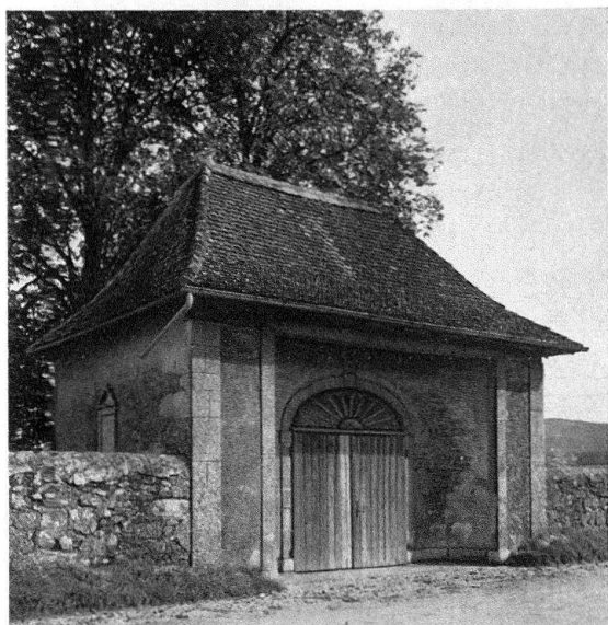
Cornaux. Le porche du cimetière (1812)