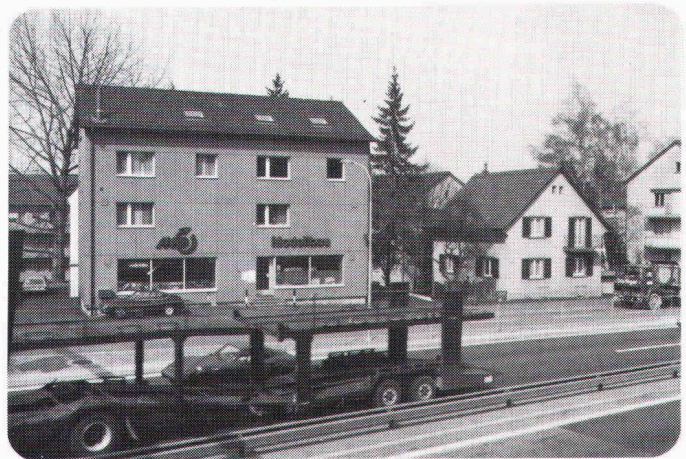
CARDOPHON ® -EXTRAPHON Wohn- und Geschäftshaus an der Überlandstrasse, Zürich