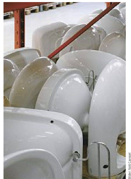
Bilder: Nott Caviezel