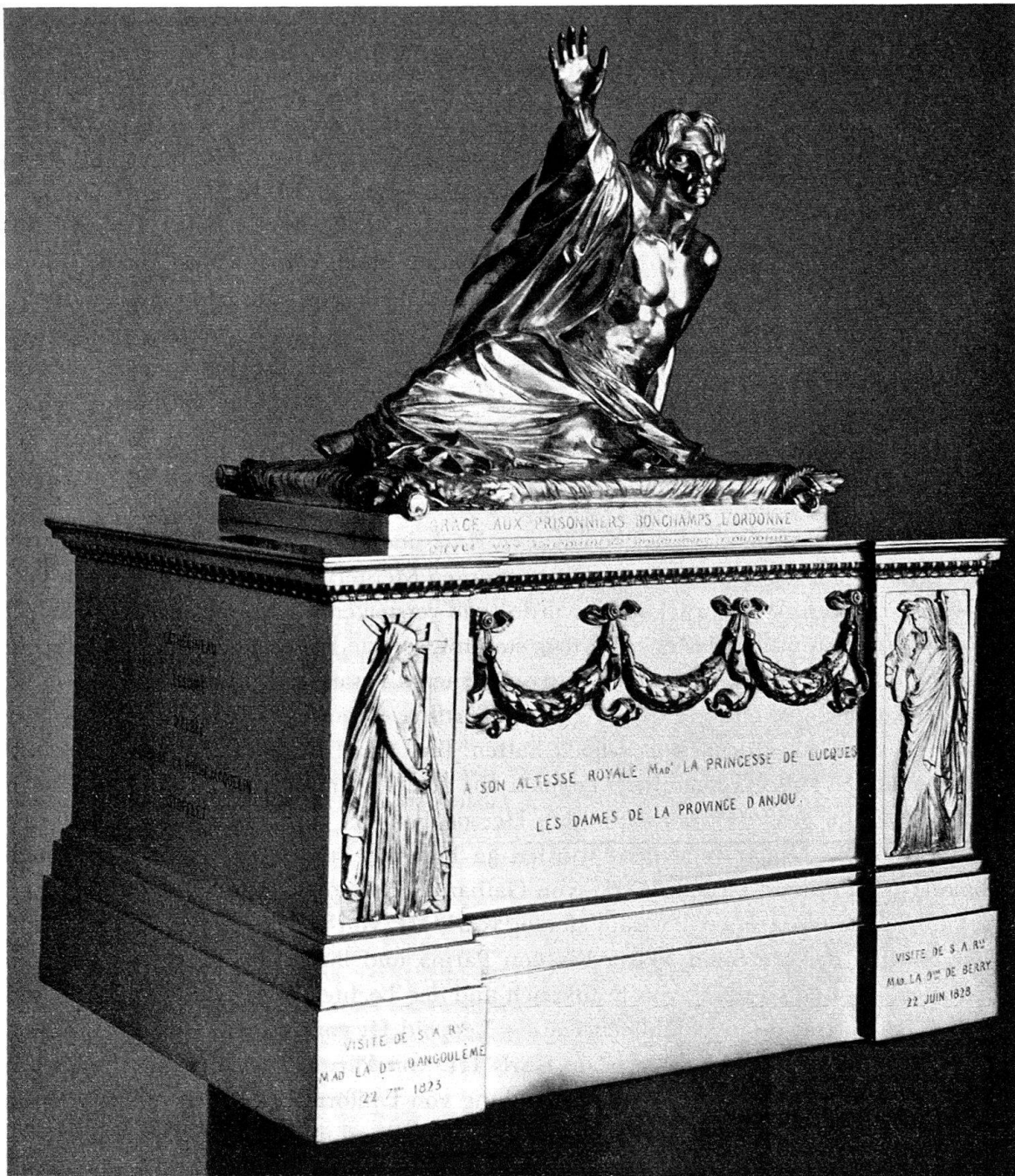
Abb. 4. Silbermodell des Grabmals General de Bonchamp's von David d'Angers, 1845

trakt mit einem Südflügel erweitert, so daß es sich jetzt als ein Bau von mehr als 40 Räumen präsentiert. Aus der Police Nr. 16698 der Feuerversicherungs-Gesellschaft Helvetia in St. Gallen vom 15. März 1870 43 ist ersichtlich, was die reiche Herzogin nach Wartegg brachte: «1. Gewöhnliche Meubles, Haus- und Küchengeräthe (Versicherungsantrag Fr. 28 000.—), 2. Leinen und Betten (8000), 3. Spiegel, Uhren, Bilder und Verzierungen (3000), 4. Porcellan, Glas und laquirte Sachen (2000), 5. zwei Claviere (2000), 6. die