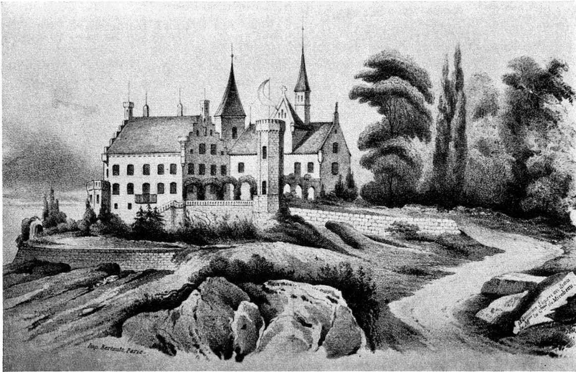
Abb. 1. Wartegg nach einer Zeichnung der Gräfin de Mirabeau-Martel (Gyp), 1861. Heimatmuseum Rorschach