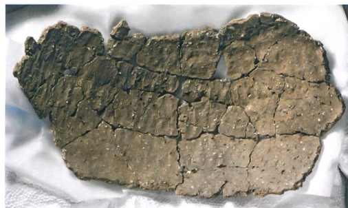
Abb. 1: Attiswil, Wiesenweg 15/17. Das Gefäss zu Beginn der Zusammensetzung: Die über 1200 Scherben sind noch flächig ausgelegt.

Im November 2013 brachte die Grabungsequipe der Fundstätte Attiswil BE, Wiesenweg 15/17, eine bronzezeitliche Keramik in das Konservierungslabor des Archäologischen Dienstes. Das Gefäss wies mit einem Durchmesser von fast 50 cm eine beachtliche Grösse auf. Es war zerdrückt und stark fragmentiert, aber schein-