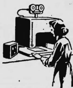
Lumprint MT 3/16 Microfilmcamara für 16 mm Film für Standard und Duo Aufnahme mit 22 und 32 facher Verkleinerung, Automatische Belichtungsregelung.