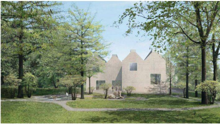
01 Siegerprojekt «Romina»

Die Zürcher Architekten Meier, Hug und Semadini gewinnen den offenen Projektwettbewerb für das neue Naturmuseum in St. Gallen.