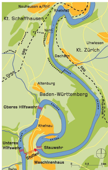
01 Gemäss einer Studie des Rheinaubundes müsste die Restwassermenge in der Rheinschleife je nach Jahreszeit auf 90 bis 130 m 3 /s erhöht werden, um den ökologischen Zustand zu verbessern (Plan: Kraftwerk Rheinau/Red.)

Der Kampf gegen das Kraftwerk in Rheinau (ZH) führte 1960 zur Gründung des Rheinaubundes und läutete einen Wendepunkt im Natur- und Heimatschutz ein. Heute engagiert sich die Umweltorganisation vor allem für den Schutz und die ökologische Verbesserung von Fliessgewässern – unter anderem wiederum in Rheinau.