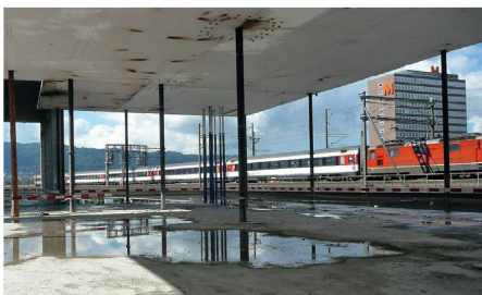
01 Die Betonstruktur der Toni-Molkerei wird zur Fachhochschule umgebaut

Eine der spektakulärsten Baustellen Zürichs war Anfang September Thema im «Energiesalon». Beim Umbau der Toni-Molkerei zur Kunsthochschule durch EM2N wird das meiste richtig gemacht.