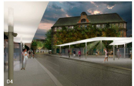
02–04 Auf städtebaulicher Ebene einigte sich die Jury auf die Vorschläge des Projektes «Promunturium»: Baumreihen stärken die Raumkanten, auf dem Platz sind Bereiche mit unterschiedlichen Aufenthaltsqualitäten vorgesehen (Plan + Visualisierungen: Projektverfassende)

überzeugte die Jury. Er garantiert in den Augen der Fachexperten, vor allem für den öffentlichen Verkehr, einen störungsfreien Verkehrsfluss. Weniger vermochte der Kreis des Projekts «Promunturium» der Verkehrsplaner Kontextplan aus Bern die Jury zu überzeugen. Sie klassifizierte ihn zwar als «nahe am Optimum», sah jedoch im Zusammenhang mit anderen Mängeln Probleme bei der Konkretisierung des vorgeschlagenen Verkehrskonzepts.