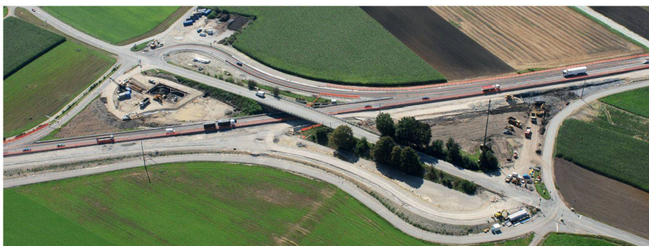
01 Luftaufnahme des Anschlusses Benken

Die ausgebaute A4 zwischen Kleinandelfingen und Flurlingen wird nach vierjähriger Bauzeit im Oktober 2010 eröffnet. Auf einen Standstreifen wurde verzichtet, was zum Namen Miniautobahn führte.