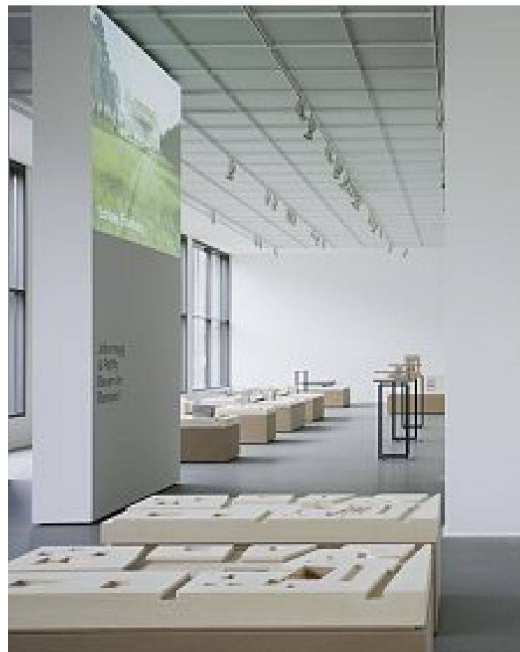
Saal der Modelle mit Projektionswand