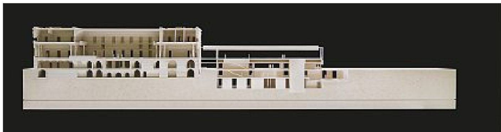
Schnitt durch das Schloss und den Haydn-Saal im Zentrum, rechts geplanter Anbau mit neuer Erschliessung und Foyers für den Haydn-Saal und grosser Terrasse mit Blick zum Schlosspark.

Katalog: Winfried Nerdinger (Hrsg.), Jabornegg & Pálffy, Bauen im Bestand, Verlag Niggli AG und Architekturmuseum der TU München, Sulgen 2009, 276 Seiten, Fr. 68.–, € 42.–, ISBN 978-3-7212-0720-0