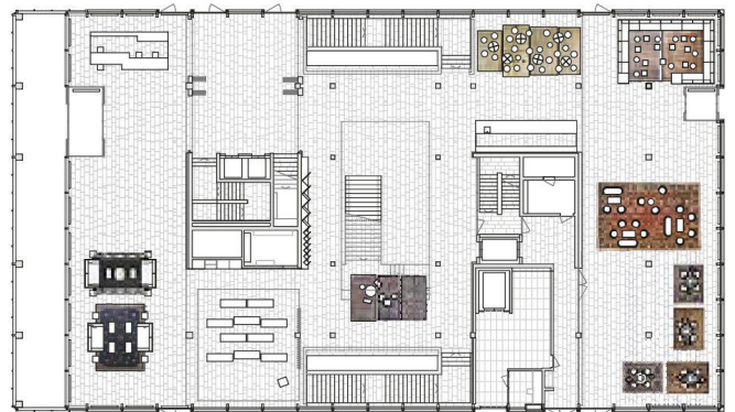
Die Welt zu Gast bei Novartis: Afrika, China (oben) und Persien (links) als möblierte Inseln im Foyer des Visitor Center