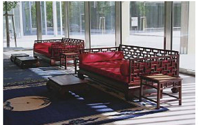
Bilder: Markti Architekt