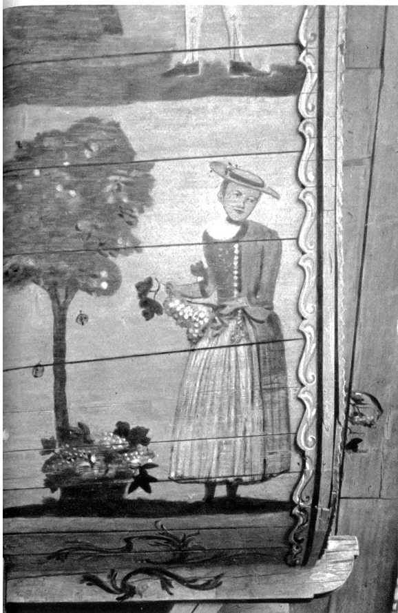
Stöckli Burren, Mengestorf. Figur auf Ründe