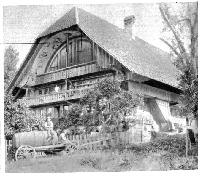
Mengestorf, Haus Burren