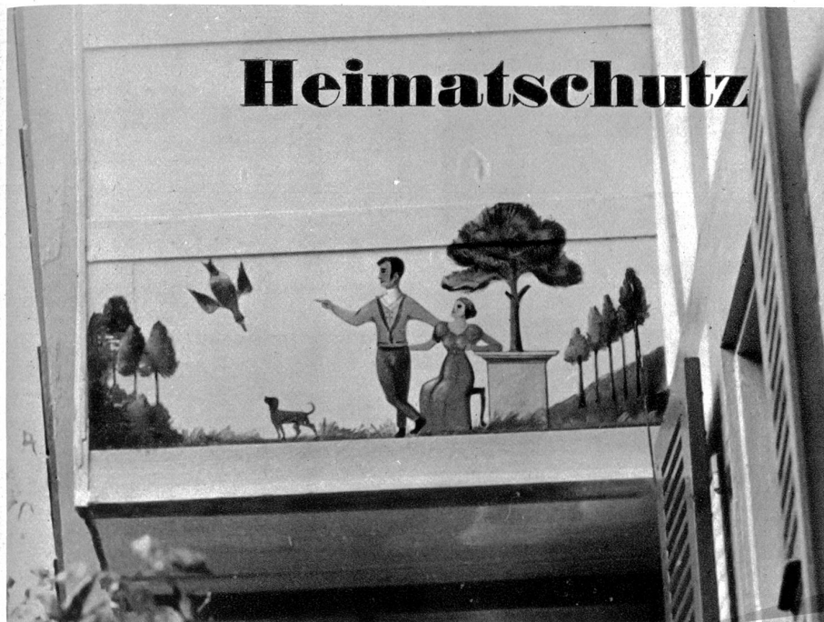
Bemalte Ründe am „Löwen“ in Bangerten