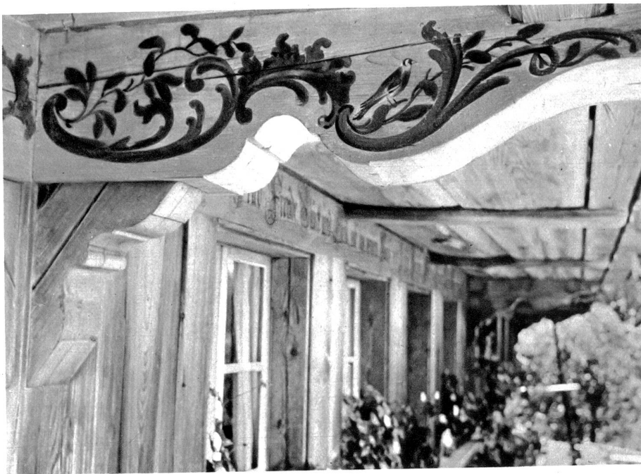
Mengestorf, Haus Burren. Bemalter Stützbalken.

schönen Bärnbietes einladen, den unmittelbar vor den Toren Berns gelegenen drei Dörfchen einen Besuch abzustatten. — Nicht alles ist da mehr „im Urzustand erhalten“ wie 1914, dafür aber steht heute in Mengestorf das Bauernhaus Burren-Locher nebst Stöckli mit den überaus reichen Malereien in neuem Schmucke da. Auch diese Renovation konnte die