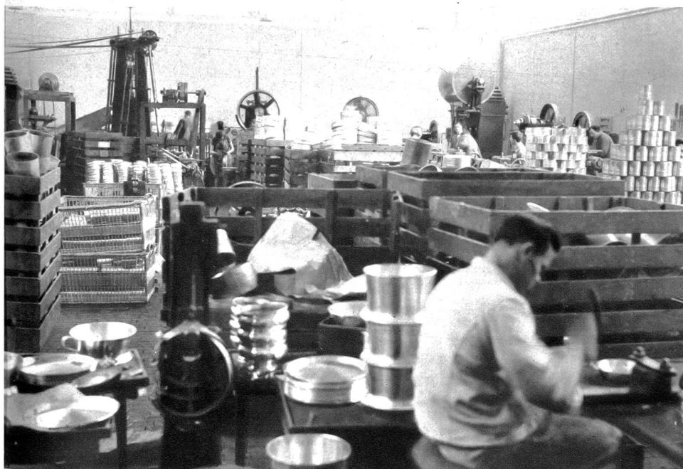
Teilansicht in einer Nieterei

kostspielig, daß an eine fabrikmäßige Gewinnung gar nicht gedacht werden konnte. Unterstützt durch Napoleon III. konnte dann der französische Chemiker Deville Versuche machen, das Metall auf elektrolytischem Wege herzustellen, was ihm auch gelang, und in den 60er Jahren wurde auf der Pariser Ausstellung erstmals ein Aluminiumbarren gezeigt, der berechtigtes Aufsehen erregte, einmal infolge des geringen Gewichtes, der