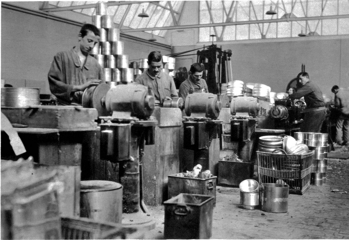
In der Schleiferei. Die egalisierten Hohlgefäße werden auf Spezial-Schleif- maschinen innen fein geschliffen.

schönen silberähnlichen Farbe, und dann aber auch wegen der großen Zieh- und Dehnfähigkeit, bei großer Härte. Aber — das Kilogramm kostete damals noch einige tausend Franken, während heute dafür nicht mehr als Fr. 3.50 angelegt werden müssen. Es ist klar, daß durch die fabrikmäßige Gewinnung dem Kupfer im Aluminium eine große Konkurrenz erwachsen ist, und heute hat das Leichtmetall überall seinen Einzug gehalten.