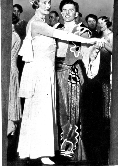
Lady und Lakai auf dem Dienstbotenball, der von Damen der Londoner Gesellschaft einmal in jedem Jahr für etwa 4000 Dienstboten gegeben wird