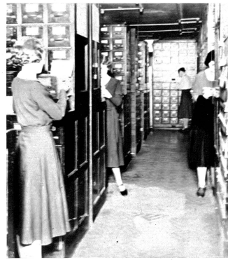
Hier liegen die Geheimnisse von Herzögen und ihren Kammerdienern geborgen. Selbst Scotland Yard hat kaum genauere Angaben über die Personals von Dienstboten und ihren hohen Herrschaften, wie diese diskrete Stellenvermittlungsgesellschaft für Hausangestellte

in die Badschüssel, deckte alles mit einem frischen Frottiertuch zu und ging dann, um die Fensterordnungen aufzulieben und zuletzt auf einem Tischchen am Bett Tee und Biskuits zu servieren. Mit einem musterhaft freundlichen „Good morning, seven o'clock, Sir!“ entwand dann das mit Häubchen und weißer Schürze gefeldete Girl wieder aus dem Zimmer. Kam man dann in den Frühstücksraum herunter, fanden all die substantiellen Öfen des berühmten englischen Frühstücks bereits auf der Anrichte, die warmen Getränke und Speisen auf Wärmeplatten, so daß sich jeder ohne Wartung nach Herzenslust bedienen konnte. Nicht viel anders fanden wir um die Mittagszeit den kalten Hund schon zum Zulangen aufgetragen. Den Nachmittagstees bereitete die Frau des Hauses selbst, und erst beim Abendessen sah ich mit Bewußtsein wieder einen dienfertigen Geist, der die Hauptmahlzeit herbeibrachte. Wie sollte ich ahnen, daß nicht weniger als sieben Dienstboten nötig waren, um diesen durchschnittlichen Haushalt einer gut gestellten Familie der oberen Mittelsklasse zu besorgen, von der Gärtnerfamilie und den Gehilfen des Gärtners ganz abgesehen. Fortsetzung auf Seite 1231.