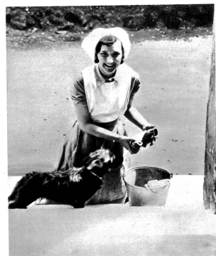
Auf der untersten Stufe: Das jüngste Hausmädchen muss die Treppen scheuern. Wenn man in der Frühe durch London geht, sieht man dieses Bild vor jedem Hause in Westend