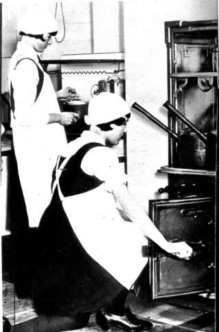
Die Küchenmädchen haben gewöhnlich nichts mit dem übrigen Hause zu tun und werden von der Köchin selbst engagiert