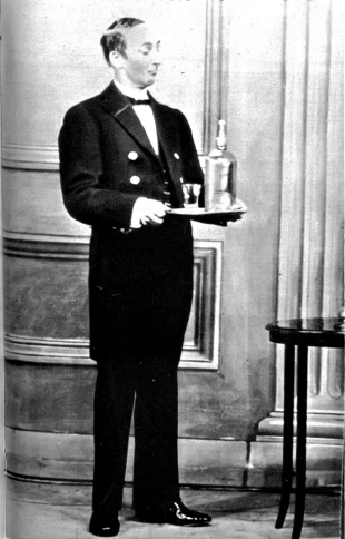
Der Typ des vollkommenen englischen Dieners