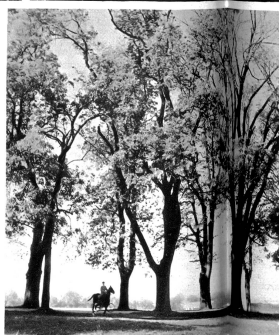
Bäume sind nicht nur Schmuckstücke einer Landschaft. In dem Masse, wie die Bäume ausgerottet werden, verschwinden unsere einheimischen Vögel. Wer möchte die einen oder die andern missen . . . ?