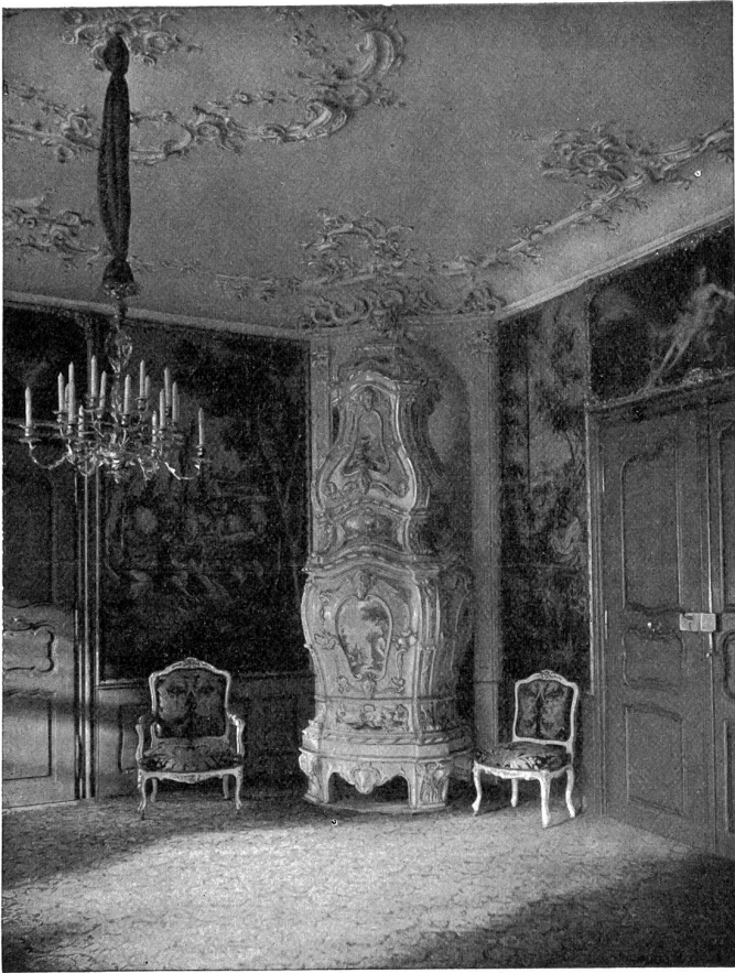
Basel, Haus zum Raben, Salon Louis XV. 1763

Da rief sie plötzlich: „Ecco mio sposo!“ 1 sprang empor und deutete gegen das Ende des Sees.