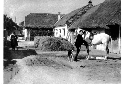
Abmarsch am frühen Morgen