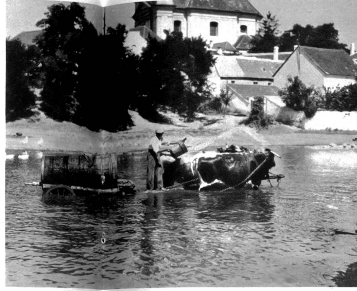
Dorfteich in der Slowakei