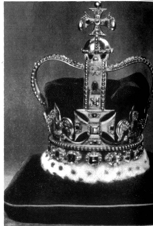
Die St. Edwards-Krone, mit der König Georg VI. gekrönt wurde