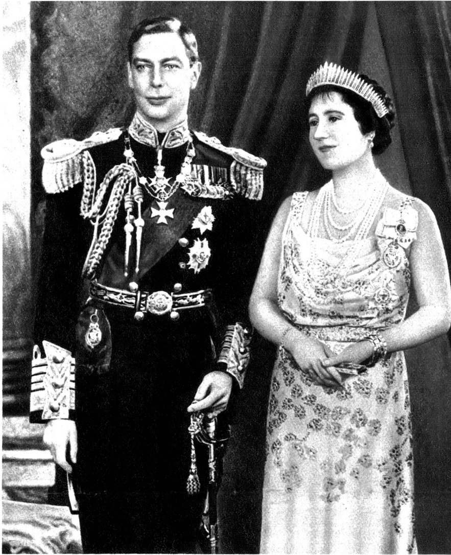
König Georg VI. und Königin Elisabeth