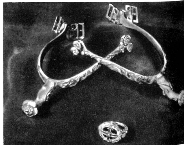
Die goldenen St. Georges-Sporren und der Krönungsring