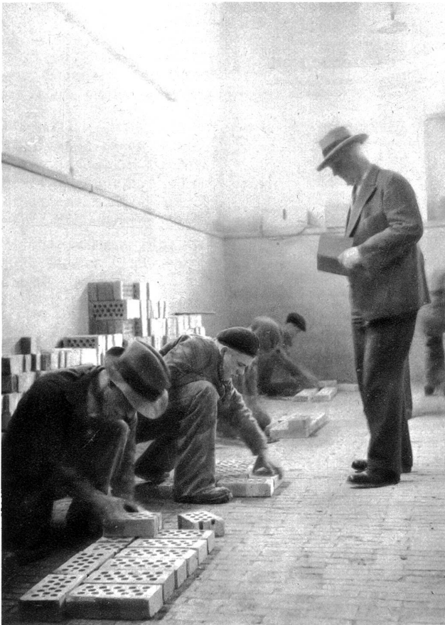
Das Anlegen von Mauerverbänden ist schwerer als wir denken. Der Experte kontrolliert und merkt jeden Fehler.