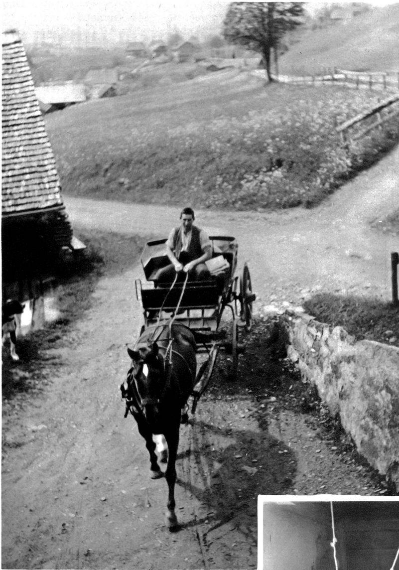
Ein Bauer aus der Umgebung, der sein Korn zum Mahlen bringt. Wenn das bisherige Tempo der Entwicklung der Grossmühlen anhält, wird dieses ländlich schöne Bild bald ganz der Vergangenheit angehören.