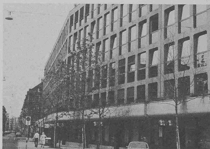
Verwaltungsgebäude der Kreistelefondirektion Zürich. Fassade aus Aluminium-Herdgussplatten

Der Martin Hilti-Preis für wissenschaftliche Arbeiten rundet die Palette von Jubiläumsvergaben ab. Der Preis ist für herausragende Arbeiten zum Thema Management- und Führungslehre gedacht und soll alle zwei Jahre in Zusammenarbeit mit der Hochschule St. Gallen und mit der Wirtschaftsuniversität Wien verliehen werden. Er ist mit jeweils 25 000 Franken dotiert.