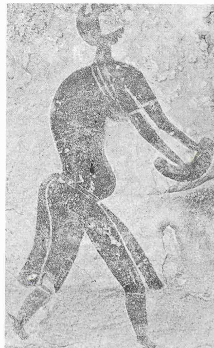
Die Felsmalereien im Tassili-Nationalpark zeugen vom einst reichen Leben in diesem Wüstengebiet

Doch die rasche Entwicklung der an den Rändern des Parks liegenden Siedlungen, die allmählich zu Städten anwachsen, sowie vor allem der Tourismus bedrohen das bereits fragile Ökosystem. Schon jetzt sind einzelne Teile der Felskunst beschädigt und das Weideland der Tuareg-Hirten von Kraftfahrzeugen verdorben. Der Plan der Unesco strebt eine vernünftige und harmonische Fortentwicklung sowie die Erhaltung des natürlichen und kulturellen Erbes an, selbstverständlich auch die Sicherung der Lebensqualität der Bewohner. Vorgeschlagen werden umweltverträgliche Formen des Tourismus und angepasste sozio-ökonomische Aktivitäten.