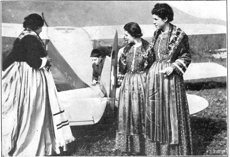
Erstes Flugmeeting in Lugano.

Der Bundesrat nahm Kenntnis vom Ertrag der Zölle im September und vom Ertrag der eidg. Stempelabgaben in den ersten 9 Monaten des Jahres. Die Zoll-