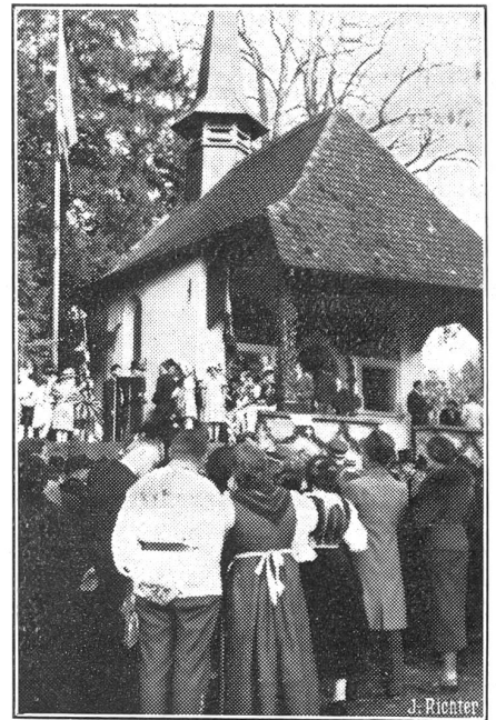
Die Schweizer Schuljugend weiht die umgebaute Hohle Gasse ein.

In den 55 Hotels und Fremdenpensionen der Stadt sind im September 17,523 Gäste angekommen. Die Zahl der Uebernachtungen war 35,433. Aus der Schweiz kamen 10,990, aus dem Ausland 6533 Gäste.