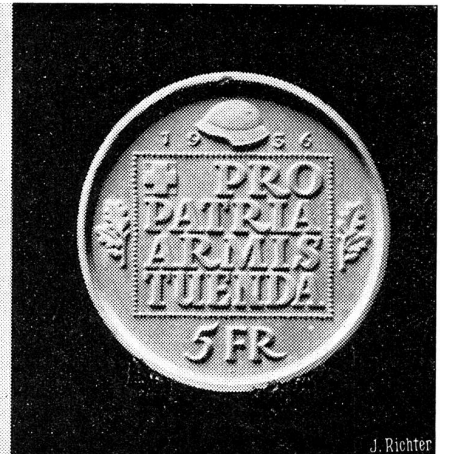
Der neue Wehranleihe-Fünfliber.

Das Preisgericht für den neuen Wehranleihe-Fünfliber, den die eidgenössische Münzstätte zur Erinnerung an die Opferbereitschaft des Schweizervolkes für den modernen Ausbau der Schweizer Armee herausgeben wird, hat die vorgelegten Arbeiten namhafter Künstler geprüft und den 1. Preis dem Genfer Künstler Max Weber zugesprochen. Dieser Entwurf wird zur Ausführung gelangen. Unser Bild zeigt die Vor- und Rückseite des mit dem 1. Preis ausgezeichneten Entwurfes.